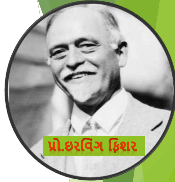
પ્રો. ઇરવિંગ ફિશર

“ વર્ષ દરમિયાન દેશના નાગરિકોએ જેટલા પ્રમાણમાં વસ્તુઓ અને સેવાઓની પ્રત્યક્ષ વપરાશ કરી હોય તેના પ્રમાણને રાષ્ટ્રીય આવક કહે છે.”